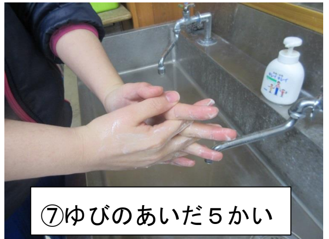
⑦ゆびのあいだ5かい