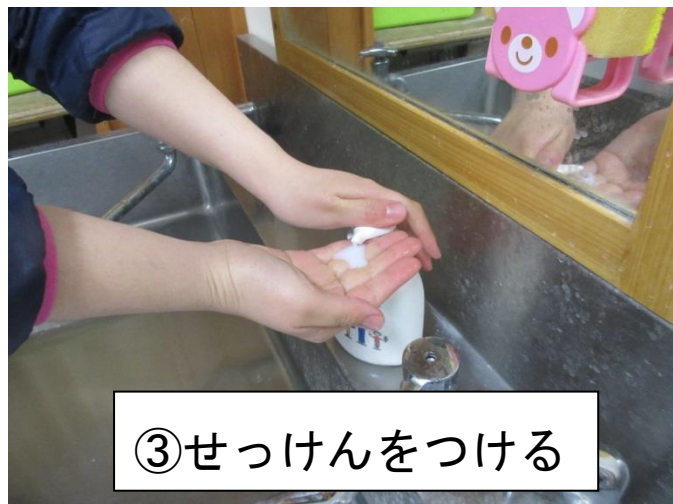
③せっけんをつける