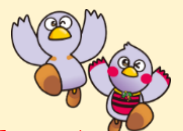
埼玉県マスコット 「コバトン・さいたまっち」